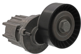
SWAG br. 30 93 7533