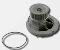
SWAG no. 40 92 4314 für 1,4 l und 1,6 l 16V Motor

Weitere technische Informationen finden Sie unter: partsfinder.bilsteingroup.com