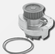
SWAG no. 40 15 0029 für den 1,8 l 16V Motor