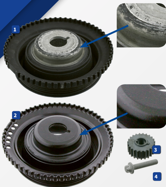
Opel 5614 430 plan

Tauschen Sie in jedem Fall die Wasserpumpe aus!