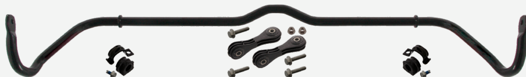
Fig. 2 Kit della barra stabilizzatrice con silentblock e biellette febi 36630

Per questa ragione febi offre il kit completo, ad esempio per VW Golf IV il codice febi 36630 (vedi fig. 2), che oltre al kit di montaggio include anche la barra stabilizzatrice. Questa combinazione permette una riparazione professionale e impedisce contestazioni. Inoltre fa risparmiare sia all'officina sia al cliente tempo e denaro!