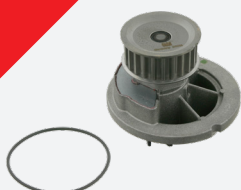
febi 24314 voor de 1,4 l en 1,6 l 16V motor

De waterpomp moet in ieder geval vervangen worden!