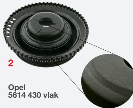
Opel 5614 430 vlak