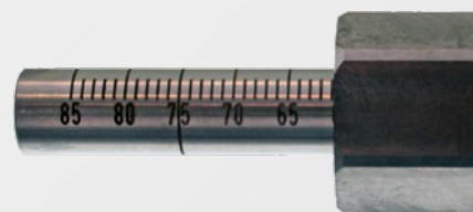
Messkettenspanner SWAG 10 94 0125