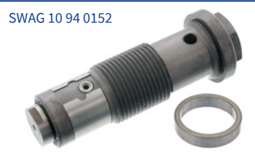
SWAG 10 94 0152

Zeigt der Messkettenspanner einen Wert von mehr als 75 (als durchgehende Linie) an, sind Teile des Kettentriebs verschlissen. In diesem Fall sollte der Kettentrieb weiter untersucht und die entsprechenden Komponenten gewechselt werden.