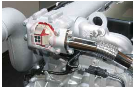
Rückschlagventil am Motor (optisch aufgeschnitten)

Dabei leisten sie, umgeben von aggressivem Abgaskondensat, Schwerarbeit bei Temperaturen bis 180°C.