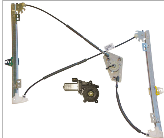
A POWER WINDOW LEFT ALZACRISTALLI ELETTRICO SX

THIS INSTALLATION INSTRUCTION IS FOR BOTH LEFT AND RIGHT SIDE. CETTE INSTRUCTION DE MONTAGE EST POUR LES DEUX COTES DROIT ET GAUCHE. DIESE MONTAGE-ANLEITUNG IST FÜR DIE BEIDE LINKE UND RECHTE SEITE. ESTA INSTRUCCION DE MONTAJE ES PARA LOS DOS LADOS IZQUIERDO Y DERECHO. ESTAS INSTRUÇÕES VALEM TANTO PARA O LADO ESQUERDO QUANTO PARA O DIREITO. DEZE AANWIJZINGEN GELDEN VOOR ZOWEL DE LINKER- ALS DE RECHTERKANT. Η ΠΑΡΟΥΣΑ ΟΔΗΓΙΑ ΑΦΟΡΑ ΤΟΣΟ ΤΗΝ ΑΡΙΣΤΕΡΗ ΟΣΟ ΚΑΙ ΤΗ ΔΕΞΙΑ ΠΛΕΥΡΑ. LA PRESENTE ISTRUZIONE VALE SIA PER IL LATO SINISTRO CHE PER IL LATO DESTRO.