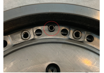
Şekil 2: Doğru Montaj

Debriyaj sistemine zarar vermektten ve gereksiz onarım çalışmalarından kaçınmak için rijit volan yüzeyindeki pim, debriyaj baskı plakasındaki merkezleme kanalına denk gelecek şekilde hizalanmalıdır.