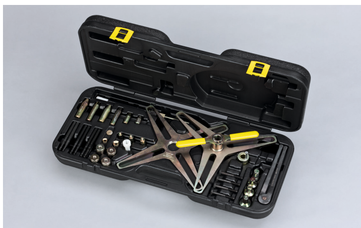
Bild 1: Spezialwerkzeug 400 0237 10 für die Kupplungsmontage

orders.gam@gedore.com Tel.: +49 (0) 771 / 8 32 23-0 Fax: +49 (0) 771 / 8 32 23-90