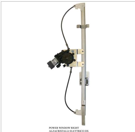
POWER WINDOW RIGHT ALZACRISTALLI ELETTRICO DX

THIS INSTALLATION INSTRUCTION IS FOR BOTH LEFT AND RIGHT SIDE. CETTE INSTRUCTION DE MONTAGE EST POUR LES DEUX COTES DROIT ET GAUCHE. DIESE MONTAGE-ANLEITUNG IST FÜR DIE BEIDE LINKE UND RECHTE SEITE. ESTA INSTRUCCION DE MONTAJE ES PARA LOS DOS LADOS IZQUIERDO Y DERECHO. ESTAS INSTRUÇÕES VALEM TANTO PARA O LADO ESQUERDO QUANTO PARA O DIREITO. DEZE AANWIJZINGEN GELDEN VOOR ZOWEL DE LINKER- ALS DE RECHTERKANT. Η ΠΑΡΟΥΣΑ ΟΔΗΓΙΑ ΑΦΟΡΑ ΤΟΣΟ ΤΗΝ ΑΡΙΣΤΕΡΗ ΟΣΟ ΚΑΙ ΤΗ ΔΕΞΙΑ ΠΛΕΥΡΑ. LA PRESENTE ISTRUZIONE VALE SIA PER IL LATO SINISTRO CHE PER IL LATO DESTRO.