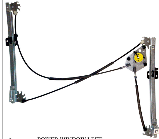
A POWER WINDOW LEFT ALZACRISTALLI ELETTRICO SX

THIS INSTALLATION INSTRUCTION IS FOR BOTH LEFT AND RIGHT SIDE. CETTE INSTRUCTION DE MONTAGE EST POUR LES DEUX COTES DROIT ET GAUCHE. DIESE MONTAGE-ANLEITUNG IST FÜR DIE BEIDE LINKE UND RECHTE SEITE. ESTA INSTRUCCION DE MONTAJE ES PARA LOS DOS LADOS IZQUIERDO Y DERECHO. ESTAS INSTRUÇÕES VALEM TANTO PARA O LADO ESQUERDO QUANTO PARA O DIREITO. LA PRESENTE ISTRUZIONE VALE SIA PER IL LATO SINISTRO CHE PER IL LATO DESTRO.