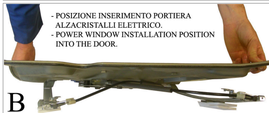
- POSIZIONE INSERIMENTO PORTIERA ALZACRISTALLI ELETTRICO. - POWER WINDOW INSTALLATION POSITION INTO THE DOOR.