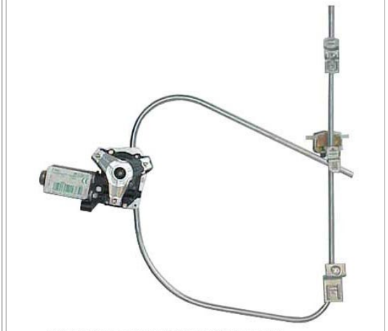
ORIGINAL POWER WINDOW RIGHT ALZACRISTALLI ELETTRICO ORIGINALE DX