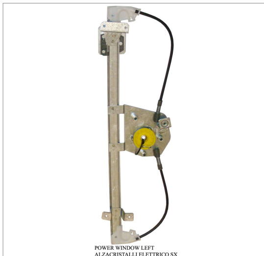
POWER WINDOW LEFT ALZACRISTALLI ELETRICO SX

THIS INSTALLATION INSTRUCTION IS FOR BOTH LEFT AND RIGHT SIDE. CETTE INSTRUCTION DE MONTAGE EST POUR LES DEUX COTES DROIT ET GAUCHE. DIESE MONTAGE-ANLEITUNG IST FÜR DIE BEIDE LINKE UND RECHTE SEITE. ESTA INSTRUCCION DE MONTAJE ES PARA LOS DOS LADOS IZQUIERDO Y DERECHO. ESTAS INSTRUÇÕES VALEM TANTO PARA O LADO ESQUERDO QUANTO PARA O DIREITO. LA PRESENTE ISTRUZIONE VALE SIA PER IL LATO SINISTRO CHE PER IL LATO DESTRO.