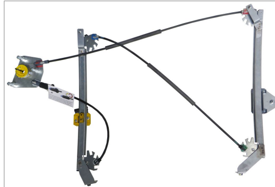
A POWER WINDOW RIGHT ALZACRISTALLI ELETTRICO DX

THIS INSTALLATION INSTRUCTION IS FOR BOTH LEFT AND RIGHT SIDE. CETTE INSTRUCTION DE MONTAGE EST POUR LES DEUX COTES DROIT ET GAUCHE. DIESE MONTAGE-ANLEITUNG IST FÜR DIE BEIDE LINKE UND RECHTE SEITE. ESTA INSTRUCCION DE MONTAJE ES PARA LOS DOS LADOS IZQUIERDO Y DERECHO. ESTAS INSTRUÇÕES VALEM TANTO PARA O LADO ESQUERDO QUANTO PARA O DIREITO. DEZE AANWIJZINGEN GELDEN VOOR ZOWEL DE LINKER- ALS DE RECHTERKANT. Η ΠΑΡΟΥΣΑ ΟΔΗΓΙΑ ΑΦΟΡΑ ΤΟΣΟ ΤΗΝ ΑΡΙΣΤΕΡΗ ΟΣΟ ΚΑΙ ΤΗ ΔΕΞΙΑ ΠΛΕΥΡΑ. LA PRESENTE ISTRUZIONE VALE SIA PER IL LATO SINISTRO CHE PER IL LATO DESTRO.