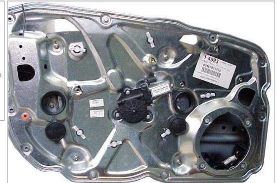
4 Doors - 4 Portes - 4 Türg - 4 Puertas - 4 Porte Front Doors - Portes Avant - Vordere Türen - Puertas Anteriores - Porte Anteriori left door - portière gauche - linke tür - puerta lado izquierdo - porta lato sinistro