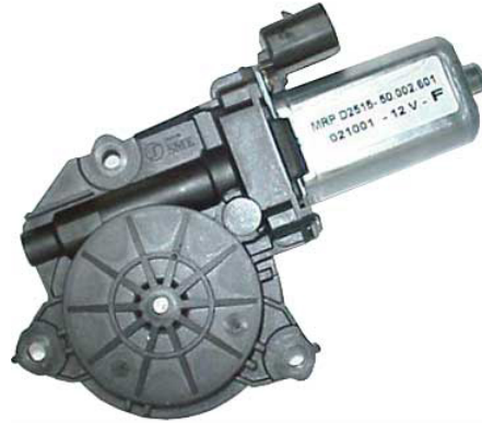
MOTOR LEFT MOTORE SX

THIS INSTALLATION INSTRUCTION IS FOR BOTH LEFT AND RIGHT SIDE. CETTE INSTRUCTION DE MONTAGE EST POUR LES DEUX COTES DROIT ET GAUCHE. DIESE MONTAGE-ANLEITUNG IST FÜR DIE BEIDE LINKE UND RECHTE SEITE. ESTA INSTRUCCION DE MONTAJE ES PARA LOS DOS LADOS IZQUIERDO Y DERECHO. ESTAS INSTRUÇÕES VALEM TANTO PARA O LADO ESQUERDO QUANTO PARA O DIREITO. DEZE AANWIJZINGEN GELDEN VOOR ZOWEL DE LINKER- ALS DE RECHTERKANT. Η ΠΑΡΟΥΣΑ ΟΔΗΓΙΑ ΑΦΟΡΑ ΤΟΣΟ ΤΗΝ ΑΡΙΣΤΕΡΗ ΟΣΟ ΚΑΙ ΤΗ ΔΕΞΙΑ ΠΛΕΥΡΑ. LA PRESENTE ISTRUZIONE VALE SIA PER IL LATO SINISTRO CHE PER IL LATO DESTRO.