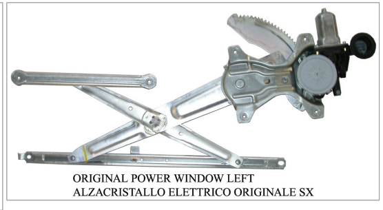
ORIGINAL POWER WINDOW LEFT ALZACRISTALLO ELETTRICO ORIGINALE SX