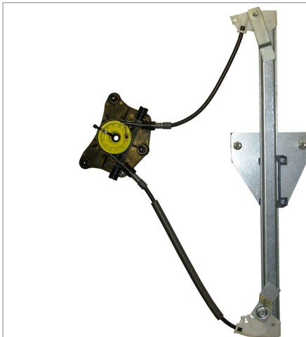
A POWER WINDOW RIGHT ALZACRISTALLI ELETTRICO DX

THIS INSTALLATION INSTRUCTION IS FOR BOTH LEFT AND RIGHT SIDE. CETTE INSTRUCTION DE MONTAGE EST POUR LES DEUX COTES DROIT ET GAUCHE. DIESE MONTAGE-ANLEITUNG IST FÜR DIE BEIDE LINKE UND RECHTE SEITE. ESTA INSTRUCCION DE MONTAJE ES PARA LOS DOS LADOS IZQUIERDO Y DERECHO. ESTAS INSTRUÇÕES VALEM TANTO PARA O LADO ESQUERDO QUANTO PARA O DIREITO. DEZE AANWIJZINGEN GELDEN VOOR ZOWEL DE LINKER- ALS DE RECHTERKANT. Η ΠΑΡΟΥΣΑ ΟΔΗΓΙΑ ΑΦΟΡΑ ΤΟΣΟ ΤΗΝ ΑΡΙΣΤΕΡΗ ΟΣΟ ΚΑΙ ΤΗ ΔΕΞΙΑ ΠΛΕΥΡΑ. LA PRESENTE ISTRUZIONE VALE SIA PER IL LATO SINISTRO CHE PER IL LATO DESTRO.