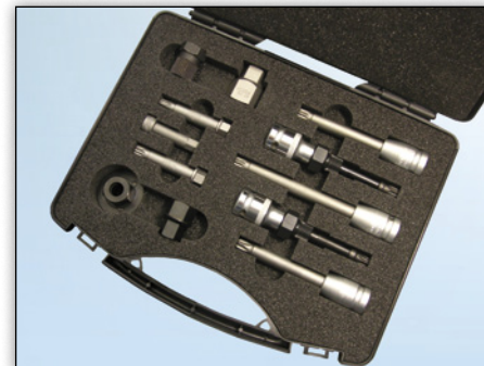
Bild 3: INA-Spezialwerkzeug Artikelnummer 400 0241 10