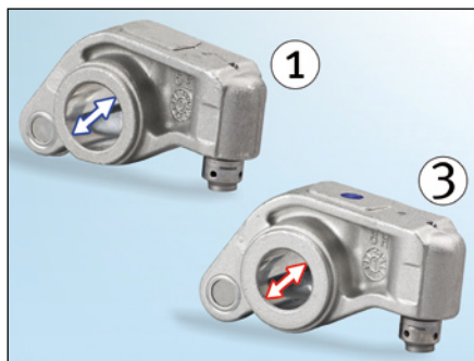
Bild 2: Der Durchmesser des Kipphebels auf der Einlassseite (1) ist größer

Beim Einbau ist auf die richtige Zuordnung zu achten. Unterschiede kann man zum einen am unterschiedlichen Durchmesser der Bohrung für die Kipphebelwelle ( Bild 2 ), zum anderen an der Kröpfung des Rollenkipphebels erkennen ( Bild 3 ).