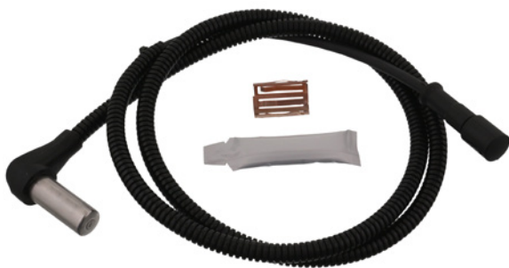
ABS - Sensor mit Hülse und Fett febi Nr. 45825

passend für: Mercedes-Benz Truck Atego I - II Vergl. Nr. 001 542 76 18