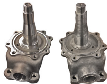
febi Nr. 19100

febi bilstein liefert die in der hauseigenen Fertigung bearbeitete neue Ausführung unter der febi Nummer 19100. Als Alternative für Fahrzeuge ohne ABS-System wird weiterhin die alte Ausführung des Achsschenkels unter der febi Sonder-Nummer 81555 angeboten.