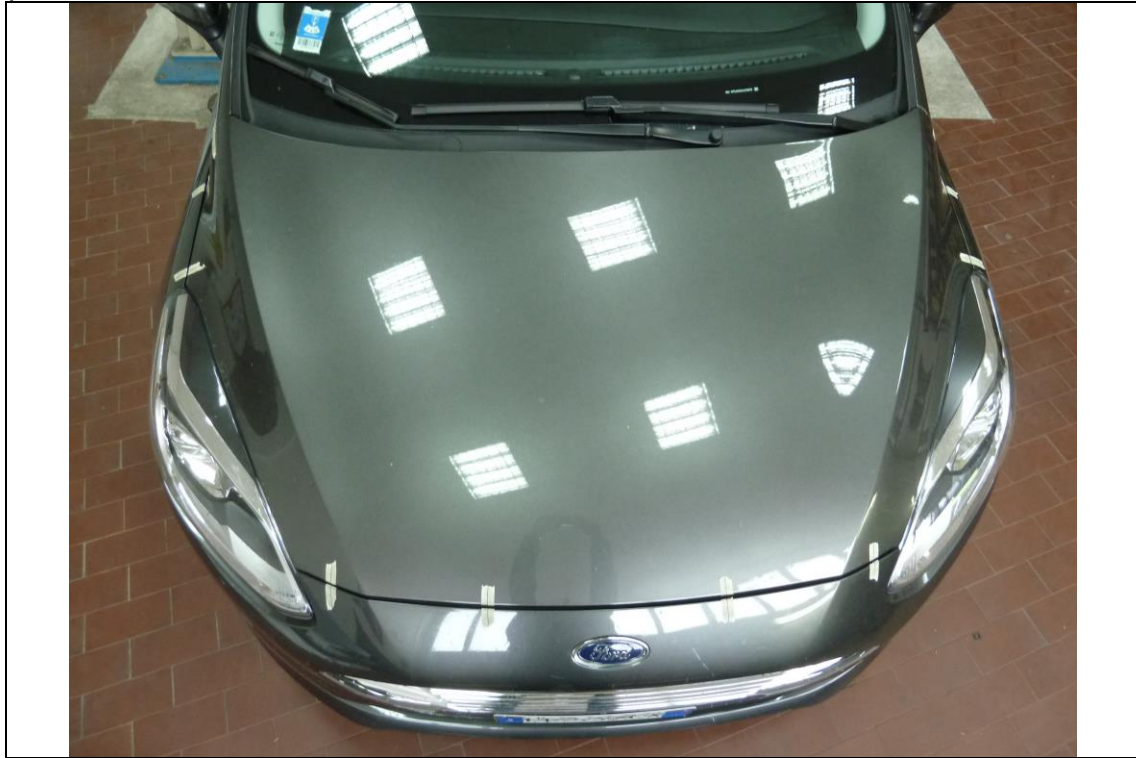
Alternative Bonnet Gaps