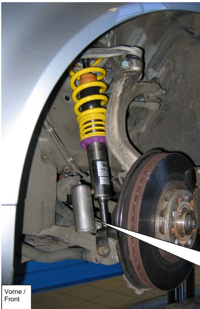
Vorne / Front

Bei Dämpferversionen mit Druckausgleichsbehälter ist dieser, wie auf dem Bild zu sehen, schräg nach vorne innen (Fahrzeuginnenseite) zu montieren.