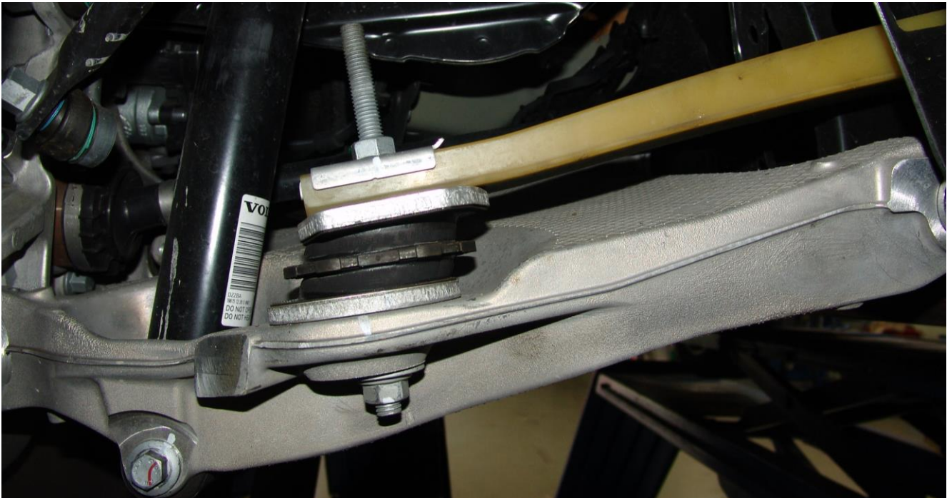
illustration 2: removing the spring pad left and right