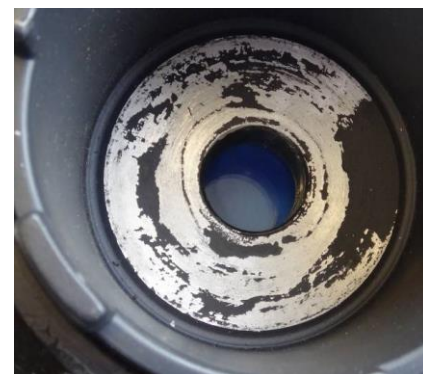
Face d'appui de la rondelle de maintien frottant à cause du jeu

La vis de fixation de la poulie de vilebrequin nécessite un serrage correct en quatre étapes : 100N.m + 60° + 60° + 30° . En cas de mauvais serrage, il y a un risque de rendre la poulie bruyante.