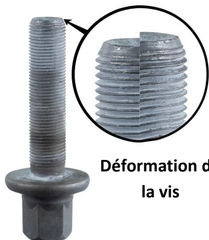
Déformation de la vis

Le boulon (vis+écrou) est un M18 x 1.5 avec une longueur maxi de 85.5 mm . Il est impératif d'utiliser une vis avec rondelle.