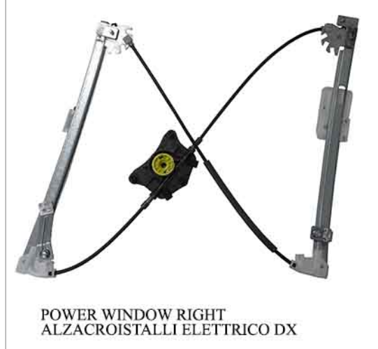
POWER WINDOW RIGHT ALZACROISTALLI ELETTRICO DX

THIS INSTALLATION INSTRUCTION IS FOR BOTH LEFT AND RIGHT SIDE. CETTE INSTRUCTION DE MONTAGE EST POUR LES DEUX COTES DROIT ET GAUCHE. DIESE MONTAGE-ANLEITUNG IST FÜR DIE BEIDE LINKE UND RECHTE SEITE. ESTA INSTRUCCION DE MONTAJE ES PARA LOS DOS LADOS IZQUIERDO Y DERECHO. ESTAS INSTRUÇÕES VALEM TANTO PARA O LADO ESQUERDO QUANTO PARA O DIREITO. LA PRESENTE ISTRUZIONE VALE SIA PER IL LATO SINISTRO CHE PER IL LATO DESTRO.