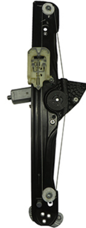
ORIGINAL POWER WINDOW RIGHT ALZACRISTALLI ELETTRICO ORIGINALE DX