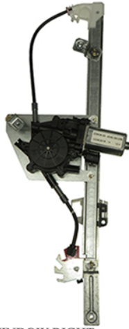
POWER WINDOW RIGHT ALZACRISTALLI ELETTRICO DX

THIS INSTALLATION INSTRUCTION IS FOR BOTH LEFT AND RIGHT SIDE. CETTE INSTRUCTION DE MONTAGE EST POUR LES DEUX COTES DROIT ET GAUCHE. DIESE MONTAGE-ANLEITUNG IST FÜR DIE BEIDE LINKE UND RECHTE SEITE. ESTA INSTRUCCION DE MONTAJE ES PARA LOS DOS LADOS IZQUIERDO Y DERECHO. ESTAS INSTRUÇÕES VALEM TANTO PARA O LADO ESQUERDO QUANTO PARA O DIREITO. DEZE AANWIJZINGEN GELDEN VOOR ZOWEL DE LINKER- ALS DE RECHTERKANT. Η ΠΑΡΟΥΣΑ ΟΔΗΓΙΑ ΑΦΟΡΑ ΤΟΣΟ ΤΗΝ ΑΡΙΣΤΕΡΗ ΟΣΟ ΚΑΙ ΤΗ ΔΕΞΙΑ ΠΛΕΥΡΑ. LA PRESENTE ISTRUZIONE VALE SIA PER IL LATO SINISTRO CHE PER IL LATO DESTRO.