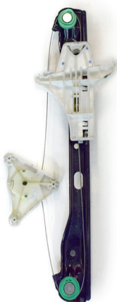
oem window regulator - lève-vitre original - Fensterheber von oem - eleva-lunas original - levantator de vidro original - Γρύλος γνήσιος - alzacristallo originale