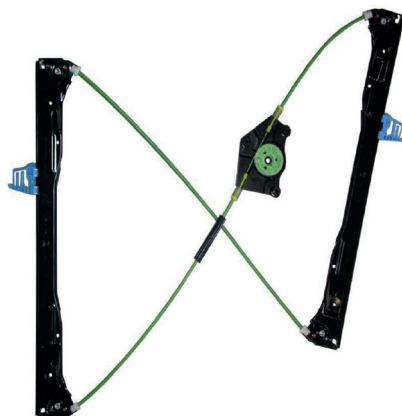
oem window regulator - lève-vitre original - Fensterheber von oem - elevalunas original - levantator de vidro original - Γρύλος γνήσιος - alzacrystallo originale