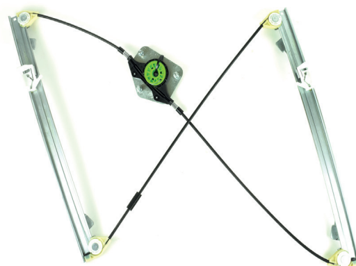
Our window regulator - notre lève-vitre - unser Fensterheber - nuestro elevalunas- nosso levantator de vidro - Γρύλος γνήσιος - nostro alzacrystallo