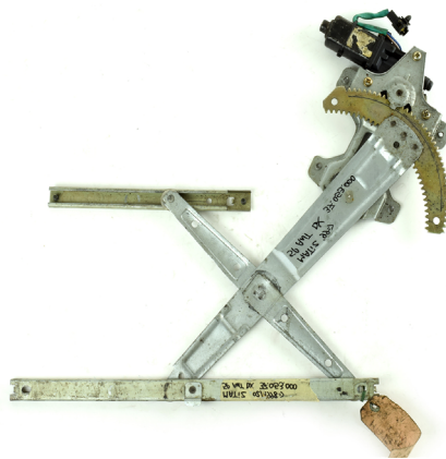
oem window regulator - lève-vitre original - Fensterheber von oem - eleva-lunas original - levantator de vidro original - Γρύλος γνήσιος - alzacrystallo originale

Chevrolet/Daewoo - Matiz - 02-98 -> 04-05