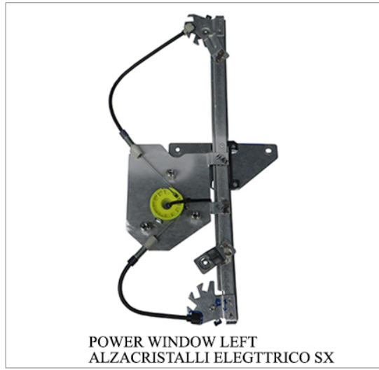
POWER WINDOW LEFT ALZACRISTALLI ELEGTRICO SX

THIS INSTALLATION INSTRUCTION IS FOR BOTH LEFT AND RIGHT SIDE. CETTE INSTRUCTION DE MONTAGE EST POUR LES DEUX COTES DROIT ET GAUCHE. DIESE MONTAGE-ANLEITUNG IST FÜR DIE BEIDE LINKE UND RECHTE SEITE. ESTA INSTRUCCION DE MONTAJE ES PARA LOS DOS LADOS IZQUIERDO Y DERECHO. AS PRESENTES INSTRUÇÕES VALEM TANTO PARA O LADO ESQUERDO QUANTO PARA O DIREITO. DEZE INSTRUCTIE IS GELDIG VOOR ZOWEL DE LINKERKANT ALS DE RECHTERKANT. ΑΥΤΗ Η ΟΔΗΓΙΑ ΕΧΕΙ ΚΑΙ ΤΗΝ ΑΡΙΣΤΕΡΗ ΠΛΕΥΡΑ ΚΑΙ ΤΗΝ ΣΩΣΤΗ ΠΛΕΥΡΑ. LA PRESENTE ISTRUZIONE VALE SIA PER IL LATO SINISTRO CHE PER IL LATO DESTRO.