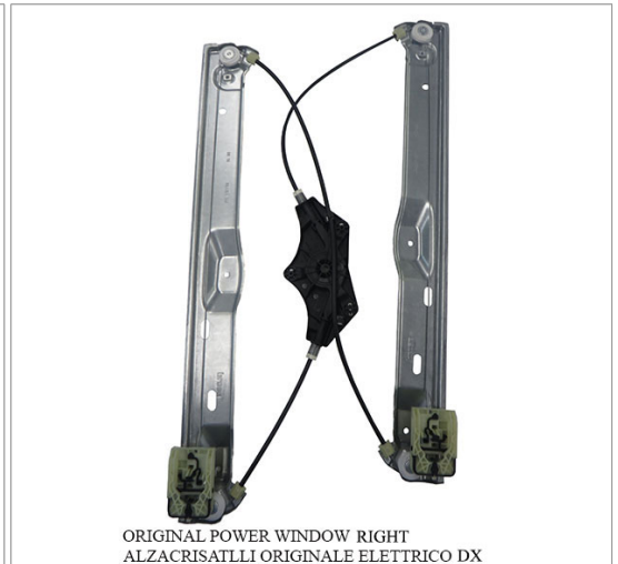
ORIGINAL POWER WINDOW RIGHT ALZACRISTALLI ORIGINALE ELETRICO DX