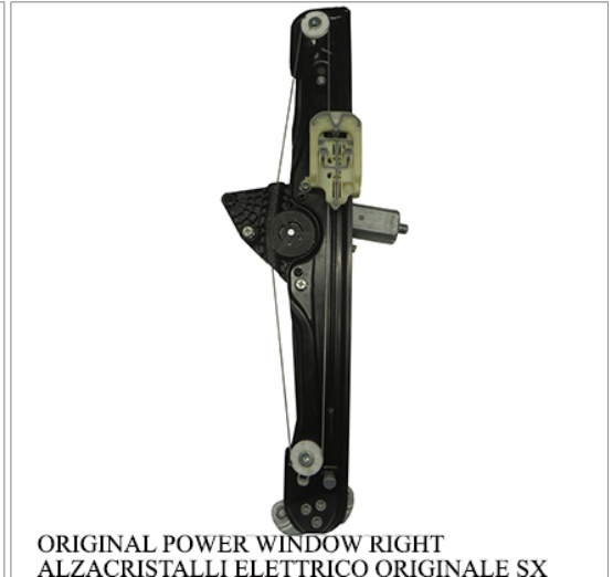
ORIGINAL POWER WINDOW RIGHT ALZACRISTALLI ELETTRICO ORIGINALE SX