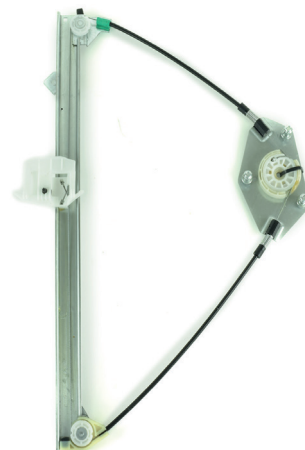
Our window regulator - notre lève-vitre - unser Fensterheber - nuestro elevalunas- nosso levantator de vidro - Γρύλος γνήσιος - nostro alzacrystallo