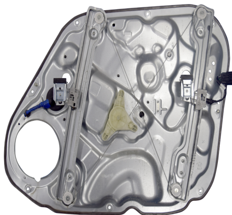
oem window regulator - lève-vitre original - Fensterheber von oem - elevalunas original - levantator de vidro original - Γρύλος γνήσιος - alzacrystallo originale