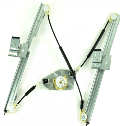
Our window regulator - notre lève-vitre - unser Fensterheber - nuestro elevalunas- nosso levantator de vidro - Γρύλος γνήσιος - nostro alzacrystallo