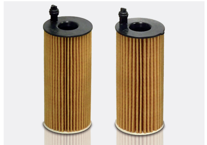
Abbildung 1: Optisch nahezu identische Ölfiltereinsätze: Links OX404 und rechts OX813/1

WICHTIG! Vor der Montage unbedingt prüfen ob der korrekte Ölfiltereinsatz vorliegt und ggf. sicherstellen ob eine Führungsnase im Inneren des Einsatzes zu sehen ist (siehe Abbildung 2).