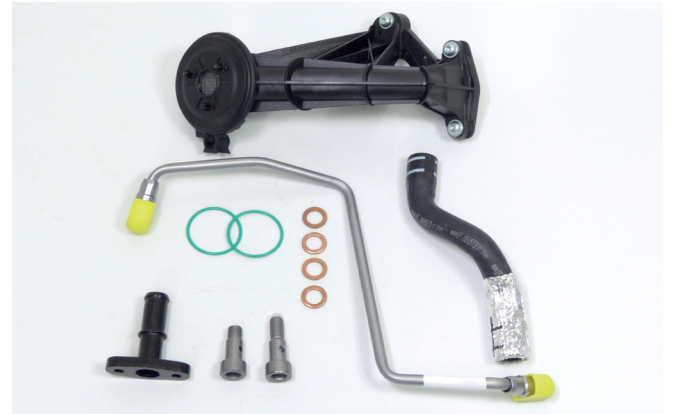
Şekil 2: 039 TK17308 010

Dolayısıyla burada mutlaka dikkat edilmesi gereken husus, doğru montaj setinin kullanılmasıdır.