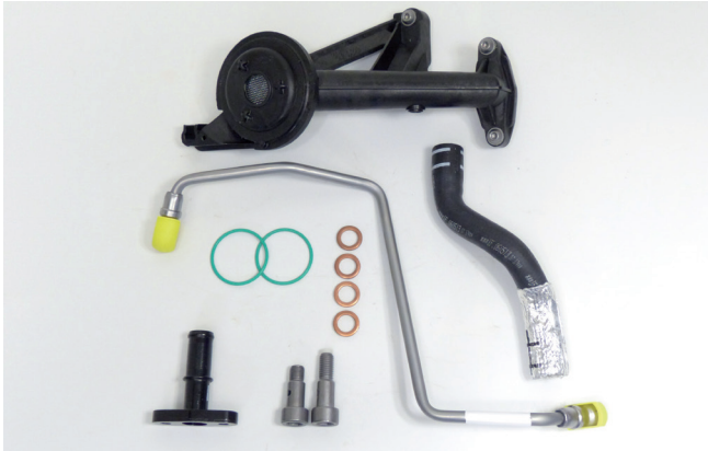
Şekil 1: 039 TK17308 000