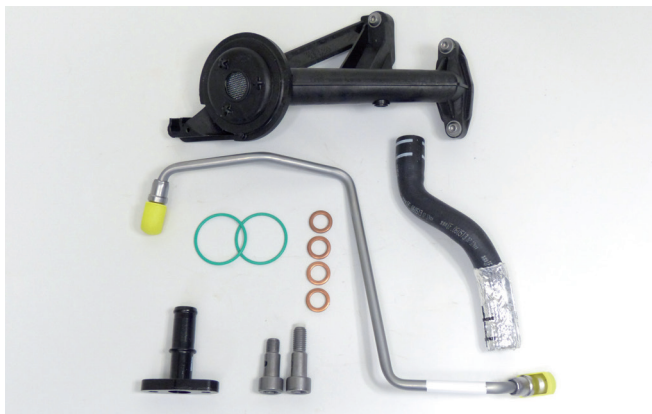
Figure 1: 039 TK17308 000