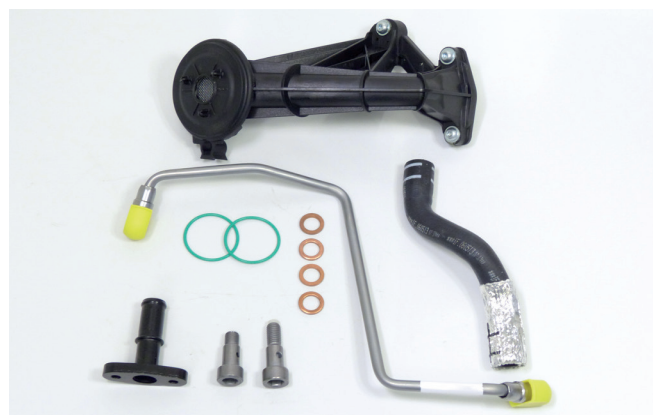
Figure 2 : 039 TK17308 010

C'est pourquoi, il est absolument nécessaire de veiller à utiliser le kit de montage correct .