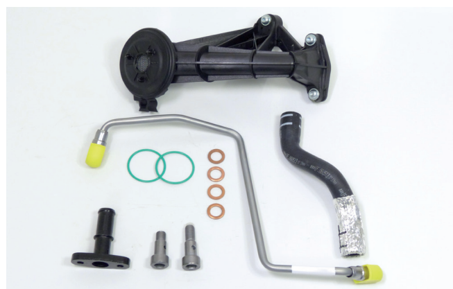
Изображение 2: 039 TK17308 010

Поэтому следует обращать особое внимание на использование подходящего монтажного комплекта .