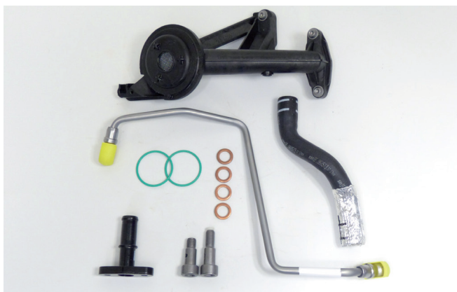
Изображение 1: 039 TK17308 000