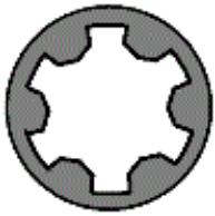
325.930 M 10x1,5x117

Schraubenkopf / Head shape Anziehreihenfolge/Tightening sequence/Ordre de serrage/Orden de apriete Tête de vis / Cabeza de tornillo