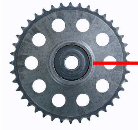
Vecchio design materiale sinterizzato

Gli ingranaggi della distribuzione GM originali per questo motore fino al numero di motore 19DN0327 sono stati realizzati con materiale sinterizzato e includevano un distanziale / rondella incorporato. I motori successivi utilizzavano ingranaggi in acciaio pressato che non necessitavano del distanziale / rondella. GM ha interrotto la produzione dei primi ingranaggi e ora offre solo i successivi ingranaggi in acciaio pressato che potete trovare in questo kit FAI.