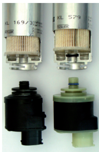
Bild 2: Der passende Heizer für den jeweiligen Kraftstoffleitungsfilter