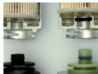
Figure 3: Distinct differences in the heater interface (short and long piece)