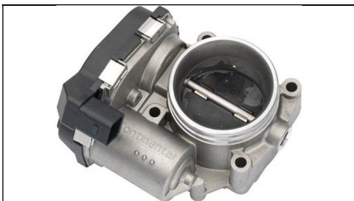
1 - Produkt / Product