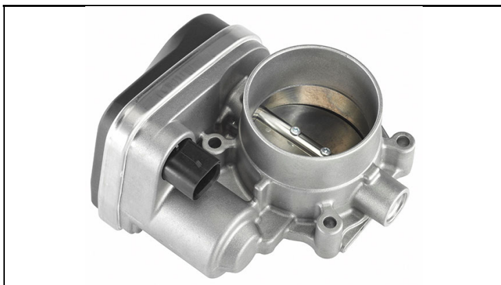
1 - Produkt / Product