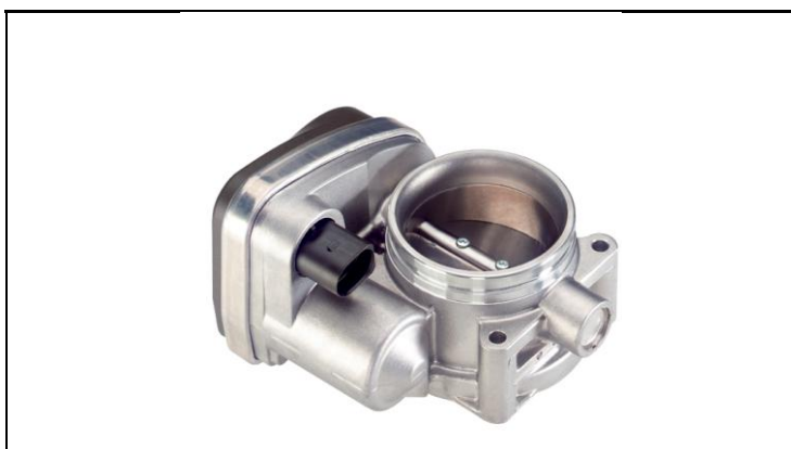
1 - Produkt / Product