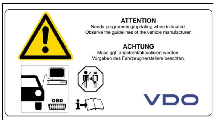
3 - Montage Hinweise / Installation Notes

Nennspannung (Positionssensor) / Nominal Voltage (Position Sensor) = 5 V