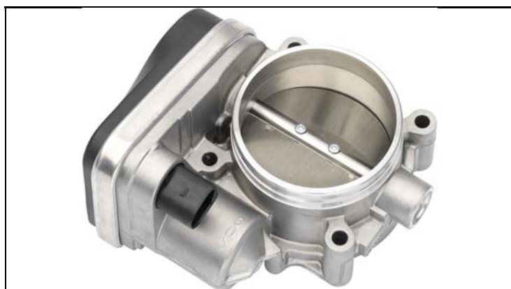
1 - Produkt / Product