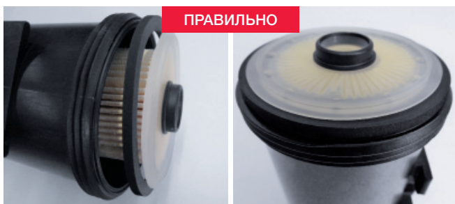
Изображение 2: Правильная последовательность монтажа