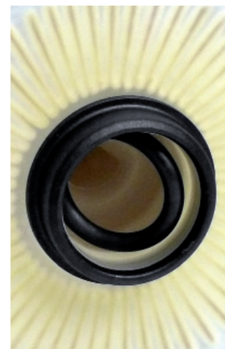
Изображение 4: Застывшая в фильтре прокладка