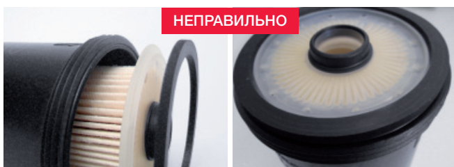
Изображение 1: Неправильная последовательность монтажа

каждый раз при замене фильтра следует контролировать посадку уплотнительного кольца!