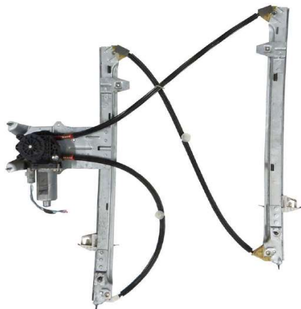
ALZACRISTALLO ELETTRICO ORIGINALE DESTRO ORIGINAL POWER WINDOW RIGHT