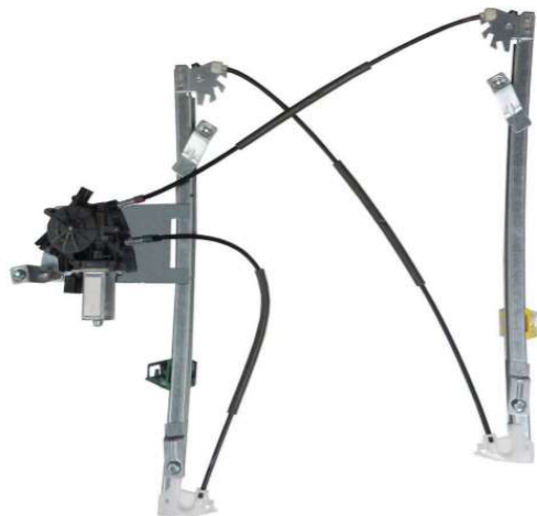
ALZACRISTALLO ELETTRICO DESTRO POWER WINDOW RIGHT

Accessori in dotazione per il montaggio - Supplied accessories for mounting - Accessoires fournis pour le montage - Montagezubehör enthalte - Se suministran componentes para el montaj - Acessórios de montagem - Εξαρτήματα για εγκατάσταση - Załączone akcesoria do montażu