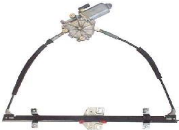
ALZACRISTALLO ELETTRICO ORIGINALE SINISTRO ORIGINAL POWER WINDOW LEFT