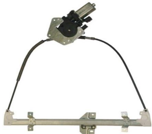
ALZACRISTALLO ELETTRICO SINISTRO POWER WINDOW LEFT

Accessori in dotazione per il montaggio - Supplied accessories for mounting - Accessoires fournis pour le montage - Montagezubehör enthalte - Se suministran componentes para el montaj - Acessórios de montagem - Εξαρτήματα για εγκατάσταση - Załączone akcesoria do montażu